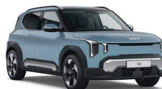
Frost Blue [EBU] solid