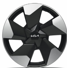
EV2 Plus 18" aluminiumfälgar 215/50 R 18