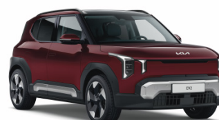
Magma Red [ARD] metallic