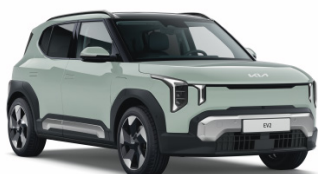
Morning Haze [DM8] solid