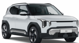
Deluxe White [HW2] metallic (pearleffekt)