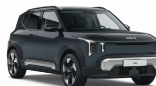
Penta Metal [H8G] metallic