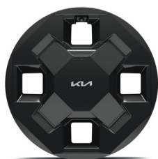
EV2 16" aluminiumfälgar 205/65 R16