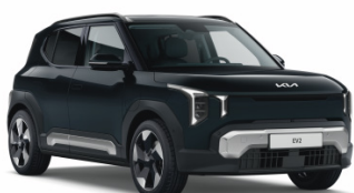
Black Pearl [1K] metallic (pearleffekt)