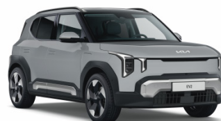
Wolf Gray [WAF] metallic