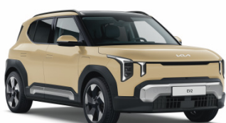
Vanilla Blossom [L3Y] metallic